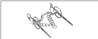
Abb. 36: Liverpool-Kandare mit KK-Conrad-Zungenfreiheit. (Achtung: Muss so angepasst sein, dass die Seitenteile leicht am Maulwinkel anliegen!)

Abb. 33 bis 35: Liverpool-Kandare mit festem, starrem Gebiss und Zungenfreiheit, auch um 90° nach vorn gekippt; mit festen oder beweglichen Seitenteilen und als Pumpgebiss zulässig.