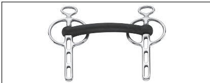
Abb. 35: Liverpool-Kandare mit starrem Gebiss und Zungenfreiheit