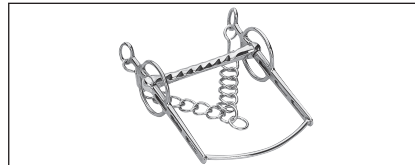
Abb. 38: Liverpool-Kandare mit Schaumbügel