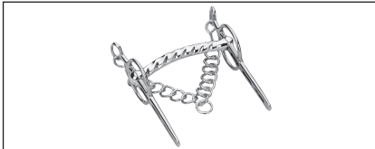
Abb. 33: Liverpool-Kandare mit festem Gebiss