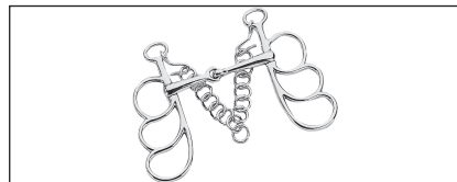
Abb. 40: Postkandare, Außenanzüge mit drei Ringen; auch mit Mundstück gemäß Abbildungstext 33 bis 37 zulässig.