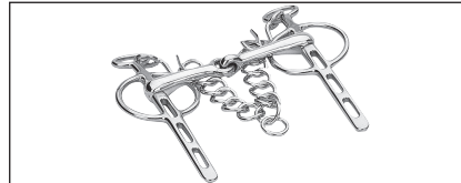
Abb. 37: Liverpool-Kandare einfach gebrochen; auch in doppelt gebrochener Form (vgl. Abb. 4) oder gebogen mit Zungenwölbung (vgl. Abb. 3) zulässig.