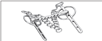
Abb. 34: Liverpool-Kandare mit starrem Gebiss